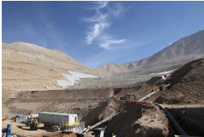
浸出用に積み上げた鉱石ダンプ（浸出液散布中）