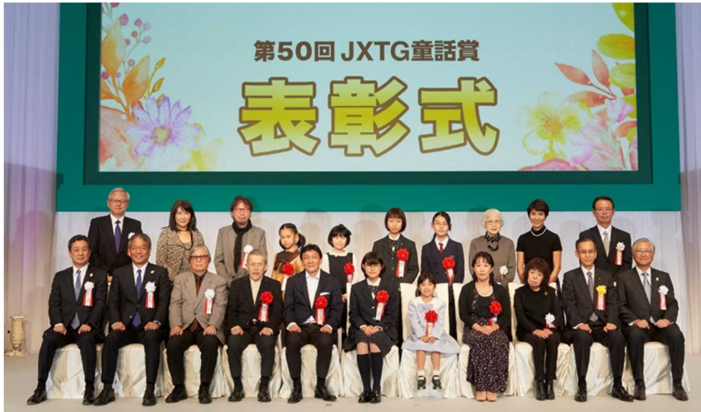
第50回JXTG童話賞 表彰式の様子