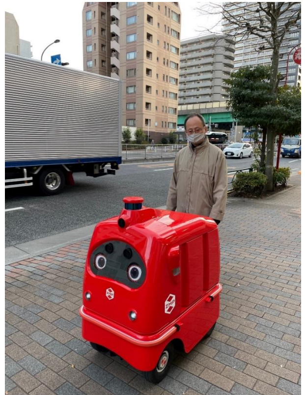
(右) 公道走行中の自動宅配ロボット