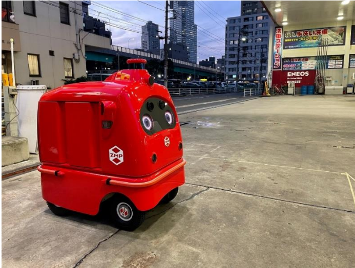
(上) Dr. Drive月島SSに停車している自動宅配ロボット