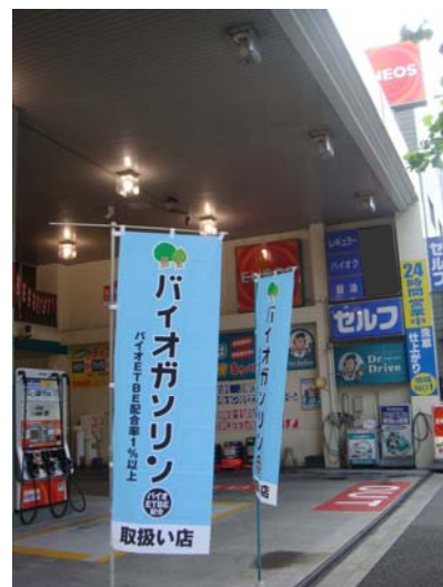
バイオガソリン取り扱いSSの店頭装飾イメージ