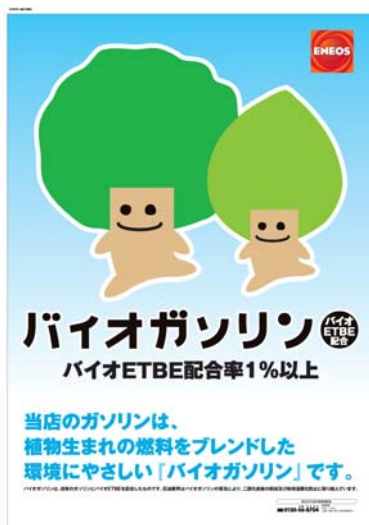
バイオガソリン取り扱いSSのポスター

《 http://www.eneos.co.jp/carlife/product/biogasoline/ 》