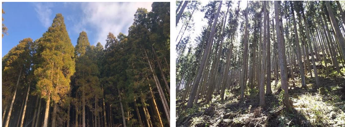
町有林（面河・美川地区）

※1 森林由来カーボンクレジットとは、間伐などの森林の適切な管理を行うことにより空気中のCO 2 を森林が吸収することで創出されるもの