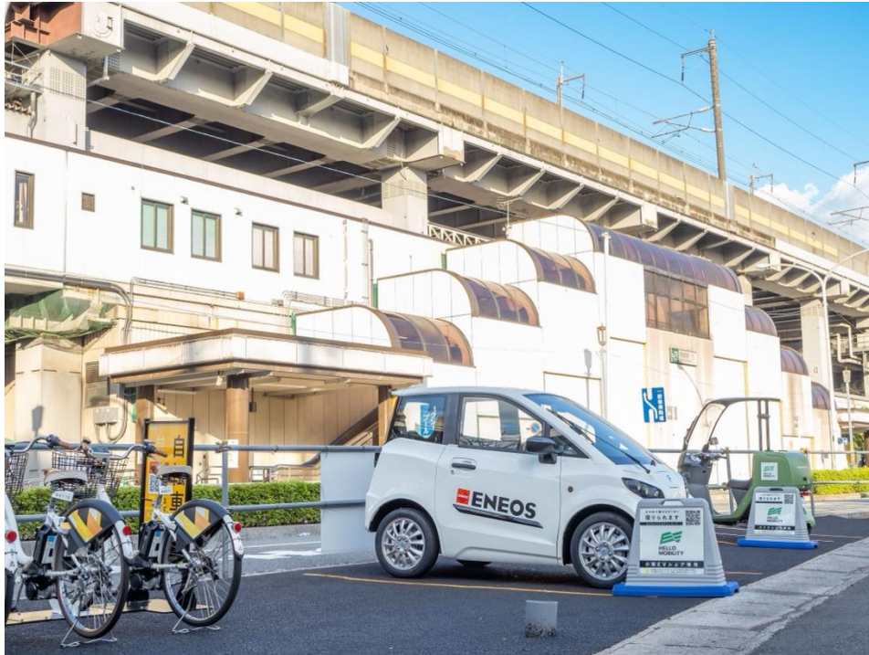
中浦和駅前ステーション