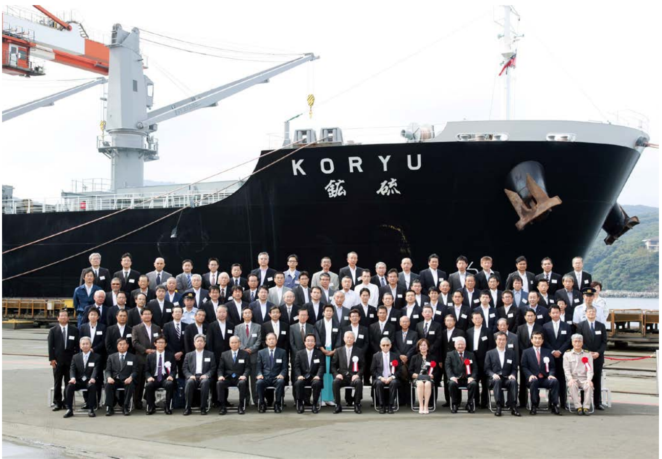
写真：式典のようす