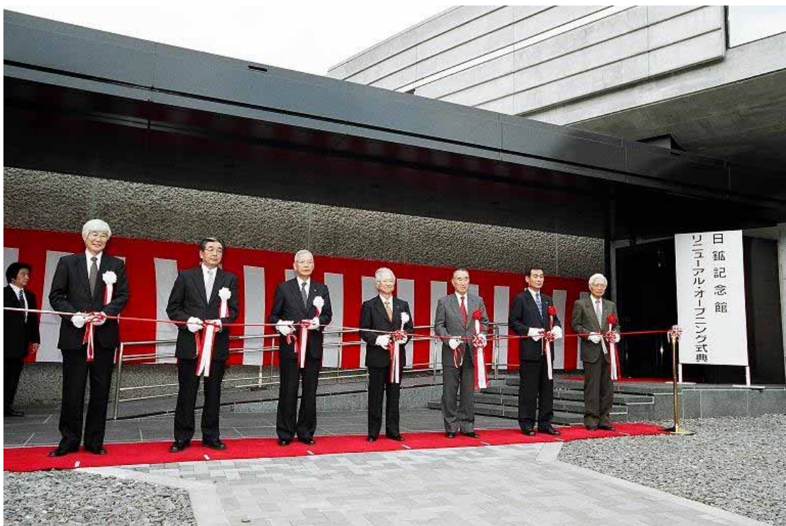
日鉱記念館オープニング式典におけるテープカット