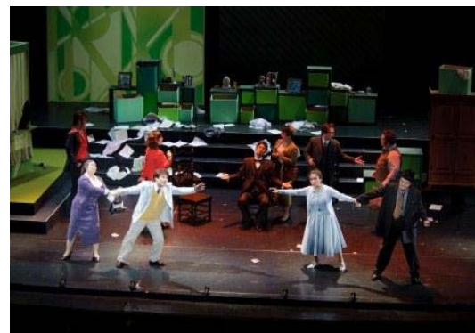
左が「妖精ヴィッリ」、右が「ジャンニ・スキッキ」。