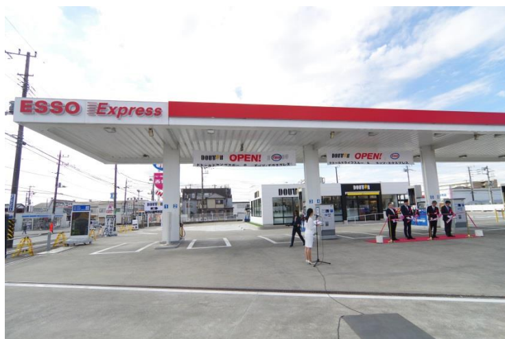
2016年12月15日両社による開所式